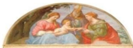
Ordine degli Avvocati di Perugia